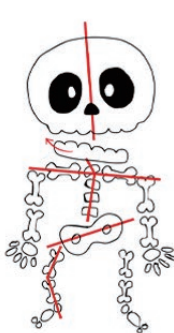
歪んだ姿勢で ズレた噛み合わせ

噛み合わせの良し悪しを左右する最も大きな要因であるのが顎位ですが、 顎位を変えると足の裏で体重を支えている場所の変化が起こります